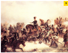
1 VOLLMER, 1979 / Repro BSG - 2 SACHSE, 1983 - 3 SEIBENMORGEN, 1998 4 JACOBET, 1968 - 5 SEIBENMORGEN, 1998 - 6 GLA, 1980 - 7 SEIBENMORGEN, 1998 Hintergrundbild: BSG Archiv